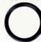
манжета резиновая для трубы гофрированной

D 315 - 1,5 t D 315 - 12,5 t D 315 - 40 t