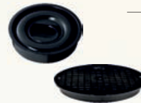
дно, крышка колодца