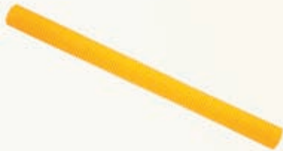
труба дренажная из ПЭ